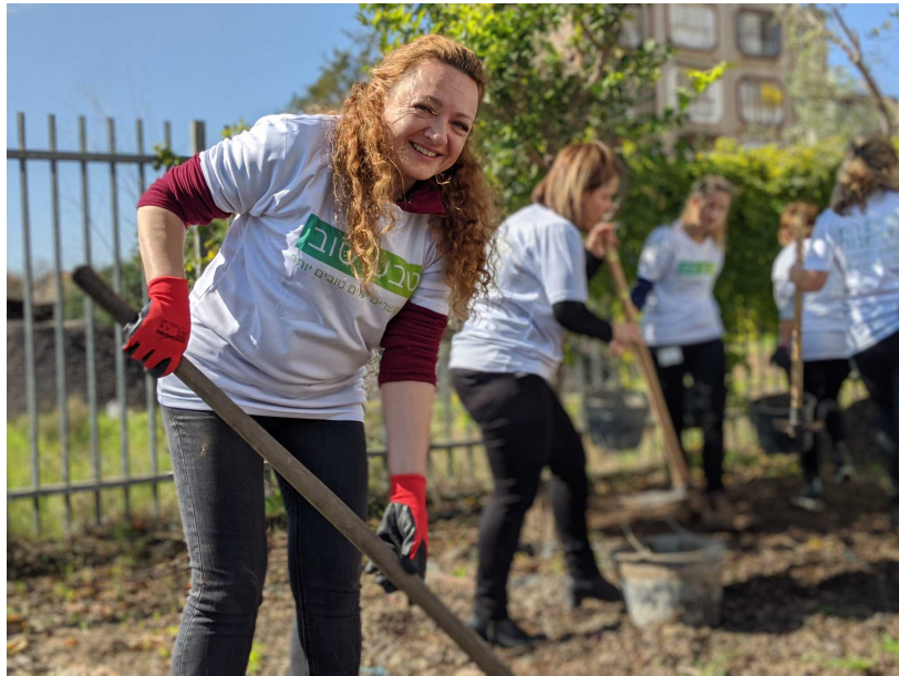
אירוע נטיעות ושיקום חצרות