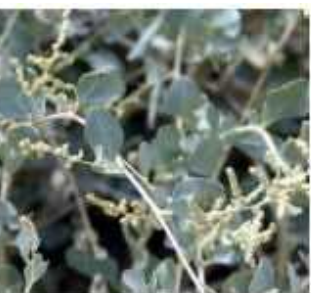
מלוח קיפח צמח מאכל ארצישראלי כמות שתילים: 1