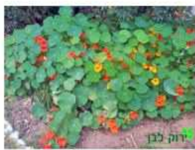
כובע נזיר כמות שתילים: 5