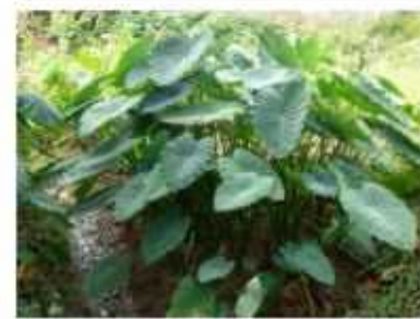
אוזן הפיל (טארון) צמח מאכל (שורש מעובה) כמות שתילים: 1