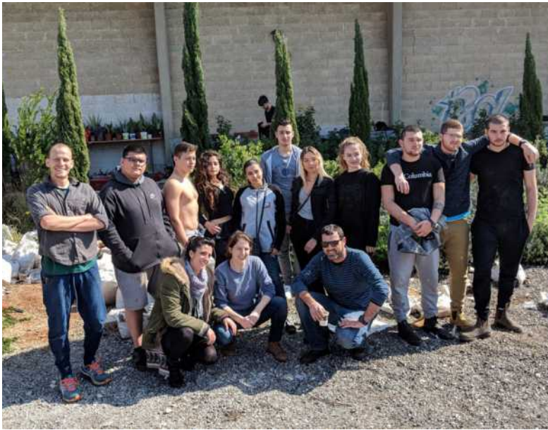
יום גיבוש אירוע חברה