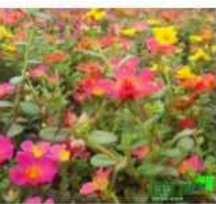
פורטולקה צמח אכיל ובריא כמות שתילים: 3