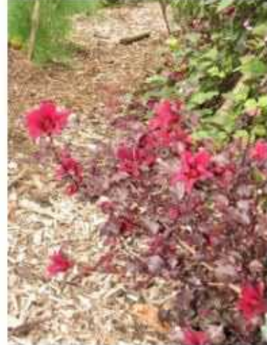
היביסקוס חמצמץ צמח תה ונוי כמות שתילים: 1