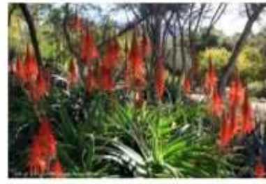
אלווי עצי צמח מרפא, מושך דבורים כמות שתילים: 1