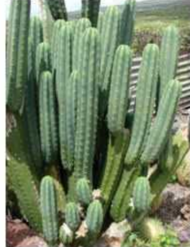
סן פדרו קקטוס מרפא וחזון כמות שתילים: 5