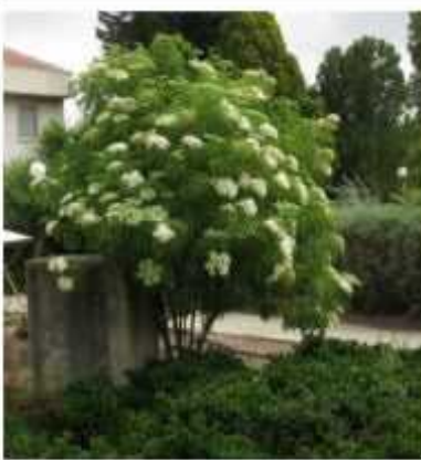
סמבוק שחור עץ מרפא בעל פריחה לבנה יפה כמות שתילים: 1