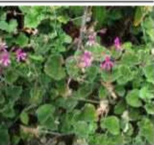
פלרגון כלייתי צמח מרפא כמות שתילים: 2