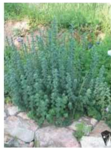
אורגנו צמח מרפא ומאכל כמות שתילים: 3 לפחות