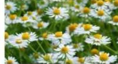
קמומיל פרח חד שנתי לרפואה ותה כמות שתילים: 3