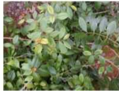
גת צמח מרפא כמות שתילים: 1