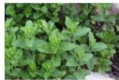
נענע צמח מרפא ותה כמות שתילים: 1