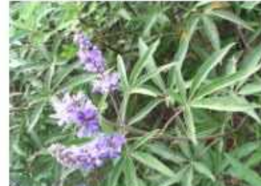
שיח אברהם צמח מרפא מקומי. מושך דבורים ומספק מרעה דבורים בעונת הקיץ כמות שתילים: 1