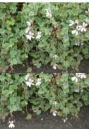
פלרגון ריחני צמח תבלין ותה כמות שתילים: 2