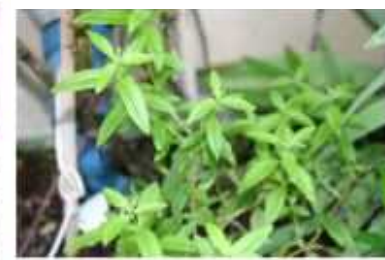
לואיזה שיח תה כמות שתילים: 1