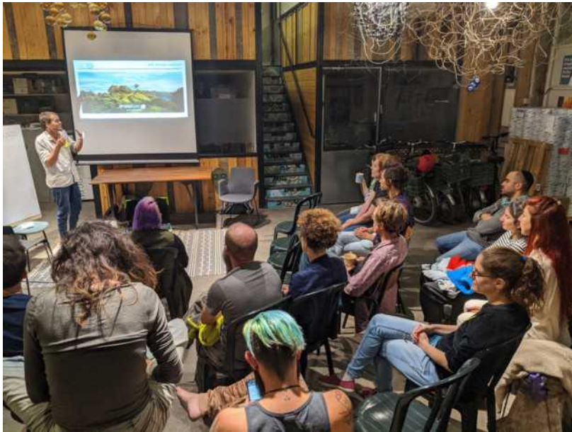
הרצאה #עיר_יער וצמיחה כלכלית 2.0