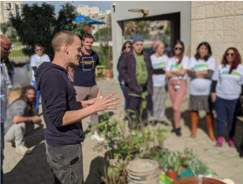
הקמת משתלה עצים על הגג