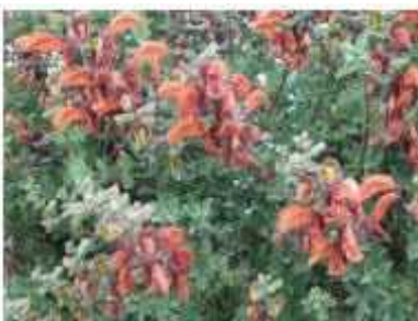
מרווה אפריקאית צהובה צמח רפואה וריח כמות שתילים: 1